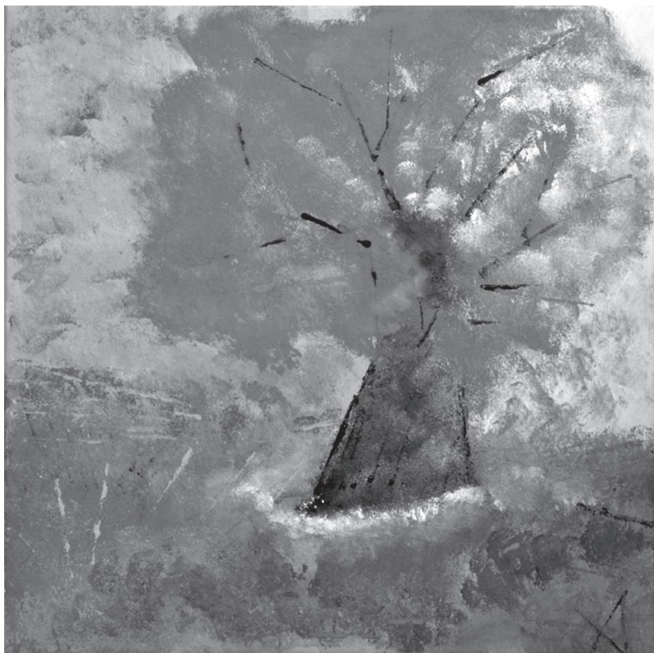
«Il pesco», 2014, cm. 40 x 40.

Orari Galleria 10,30- 12,30 / 16,30 – 19,30 chiuso: domenica, Lunedì, Martedì.